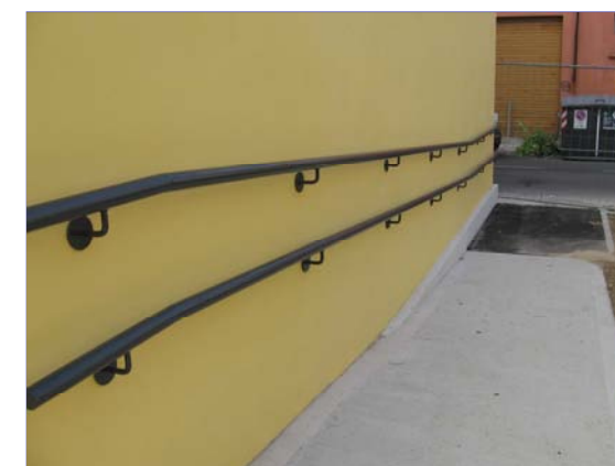
Rampe e corrimano per disabili

Sia al primo che al secondo piano si trovano altre due sale di dimensioni inferiori, servite dall'ascensore, che saranno destinate a ludoteca e sala lettura.