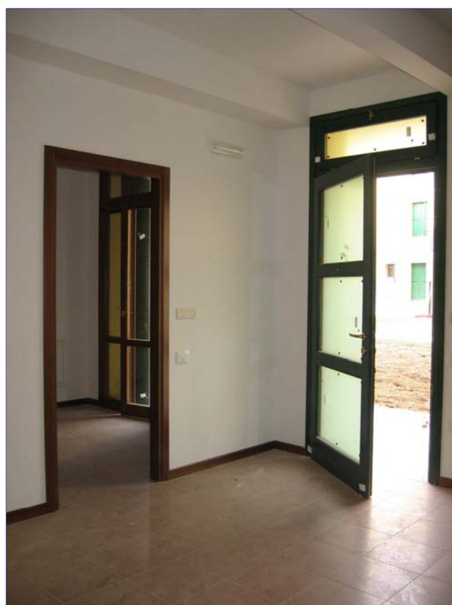
Particolari interni degli alloggi

Intervento per la ristrutturazione dei fabbricati denominati “A” e “D” facenti parte del complesso in Comune di Padova, delimitato dalle Vie Magenta, Dottesio, Varese e Toselli, con ricavo di n. 72 alloggi di Edilizia Residenziale Pubblica, di cui n. 22 per anziani, e relativi spazi accessori. 3° stralcio del "Contratto di Quartiere Savonarola"